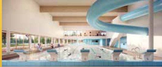
Zwembad Lille: een stand van zaken (p.2)