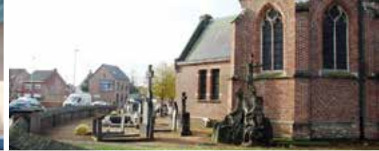
Nieuwe kerktuin voor Poederlee (p.3)